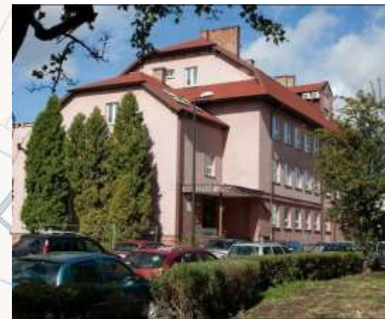
ul. Szkolna 18