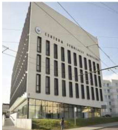
ul. Chodźki 4